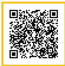
ログインページQRコード

①下記QRコードまたはロンドスクールマックス成増のホームページより、「WEB振替」へアクセスしてください。